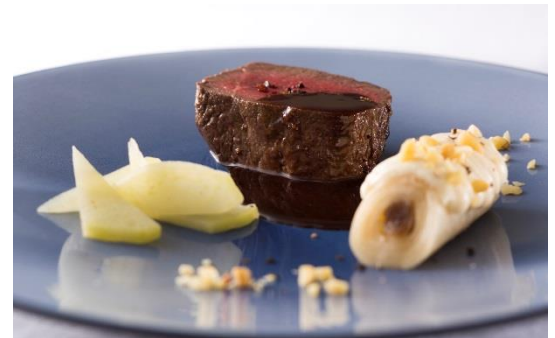
鹿のロースト ソースシヴェ ※メニューは都合により変更になることがあります