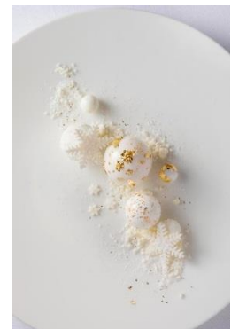
ビジュードノエル ※メニューは都合により変更になることがあります

※12/23～24の2日間はクリスマスコースのみ、12/22、25はクリスマスコースと通常コースをご提供します