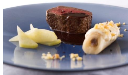
※昨年メニューの一例