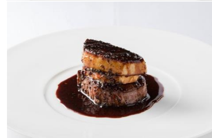
※昨年メニューの一例