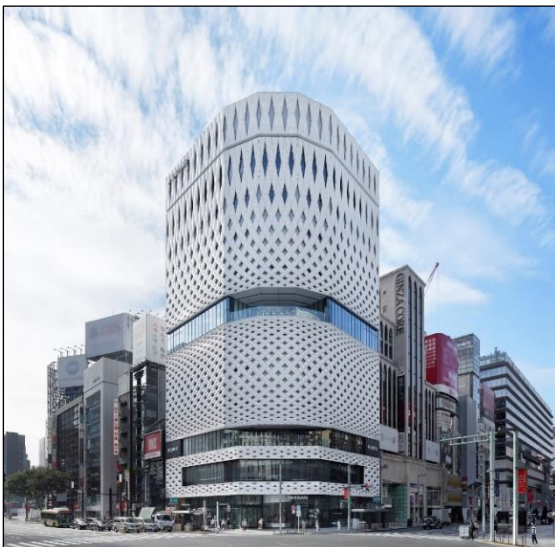
GINZA PLACE 外観

「GINZA PLACE」の3階に新登場するパノラマスペース common ginza は、世界有数の繁華街、銀座の中心である銀座4丁目交差点を眼下に見下ろす、多目的イベントスペースです。GINZA PLACEのコンセプト「発信と交流の拠点」を象徴する施設であり、プレス発表会、展示会、ポップアップストアなど様々なイベント開催にご利用いただけます。