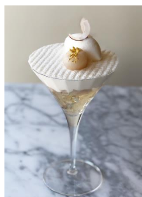
③ Champagne litchi