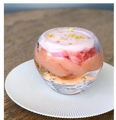
④ Pêche BELLINI