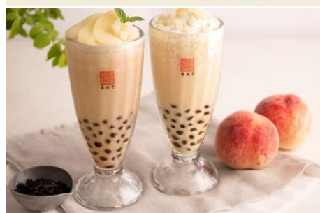
(左) タピオカ白桃鉄観音ミルクティー (右) タピオカ白桃ミルクティー